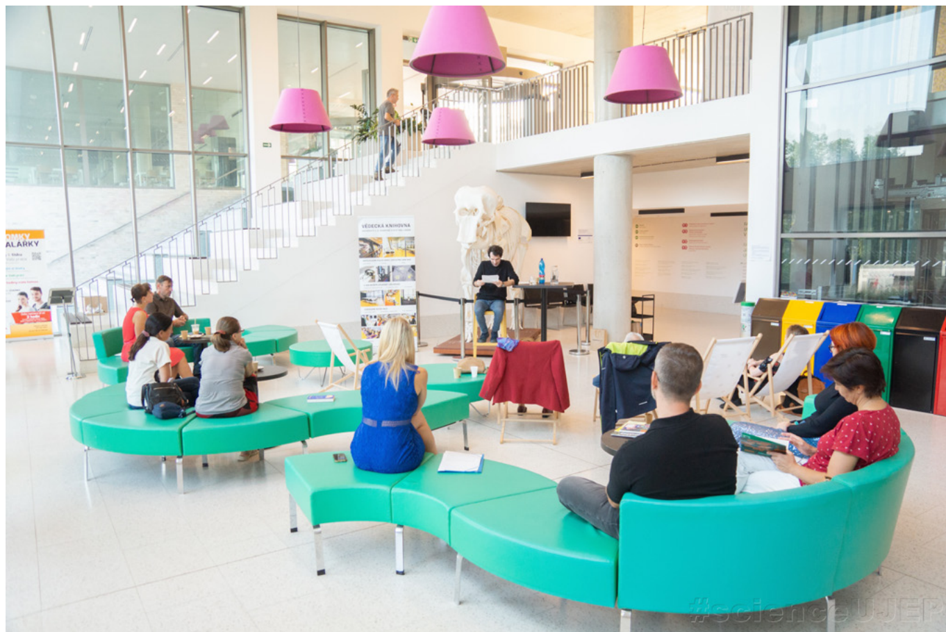
Ústí nad Labem