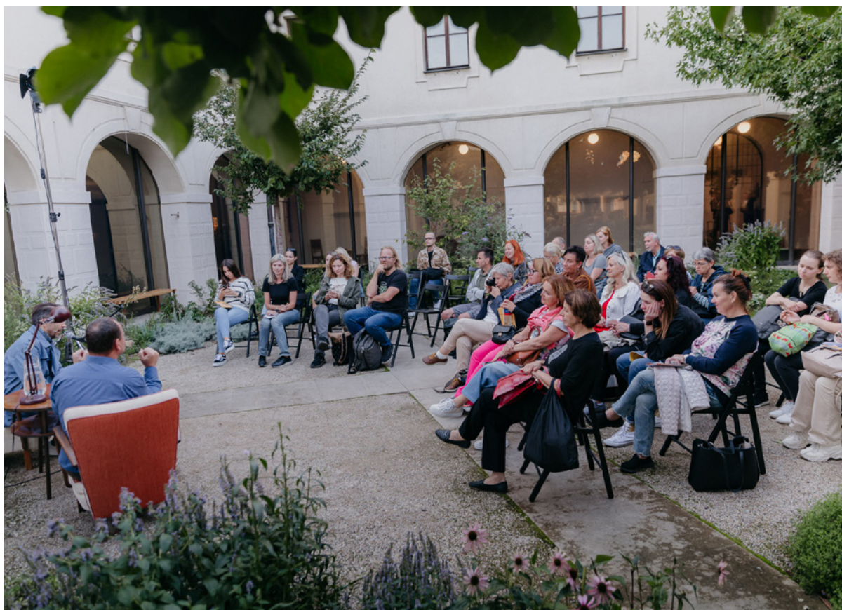
Dánsko – Fortna - I