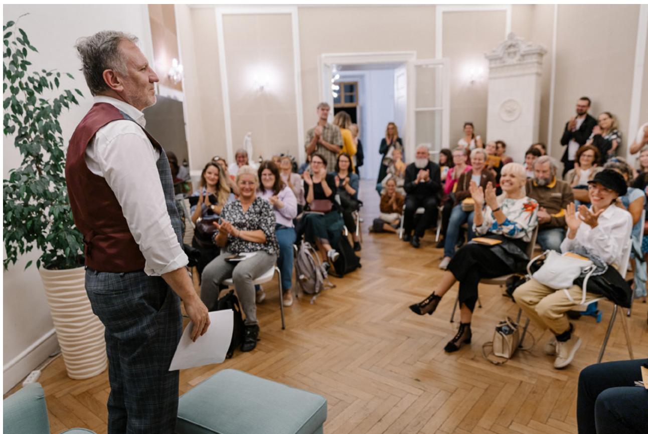
Belgie – společnost Aspironix s.r.o.

Noc literatury v Praze propojuje výběrem čtecích míst část města, v níž se koná. Na Hradčanech se letos otevřely nejen brány majestátních paláců , ale také běžně nedostupné prostory klášterů, soukromých prostor či škol a jiných unikátních objektů, které jejich provozovatelé laskavě návštěvníkům otevřeli.