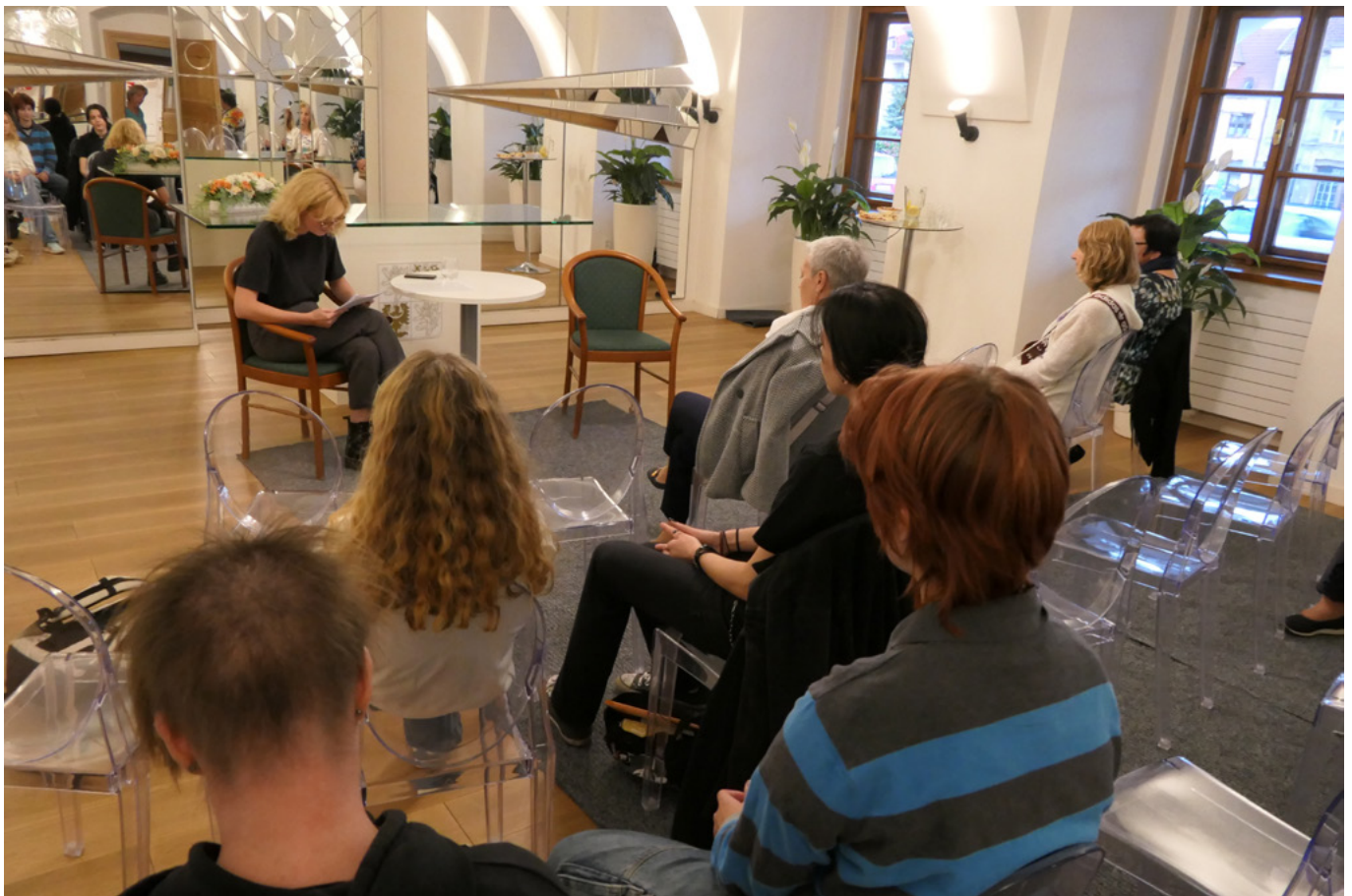
Lysá nad Labem