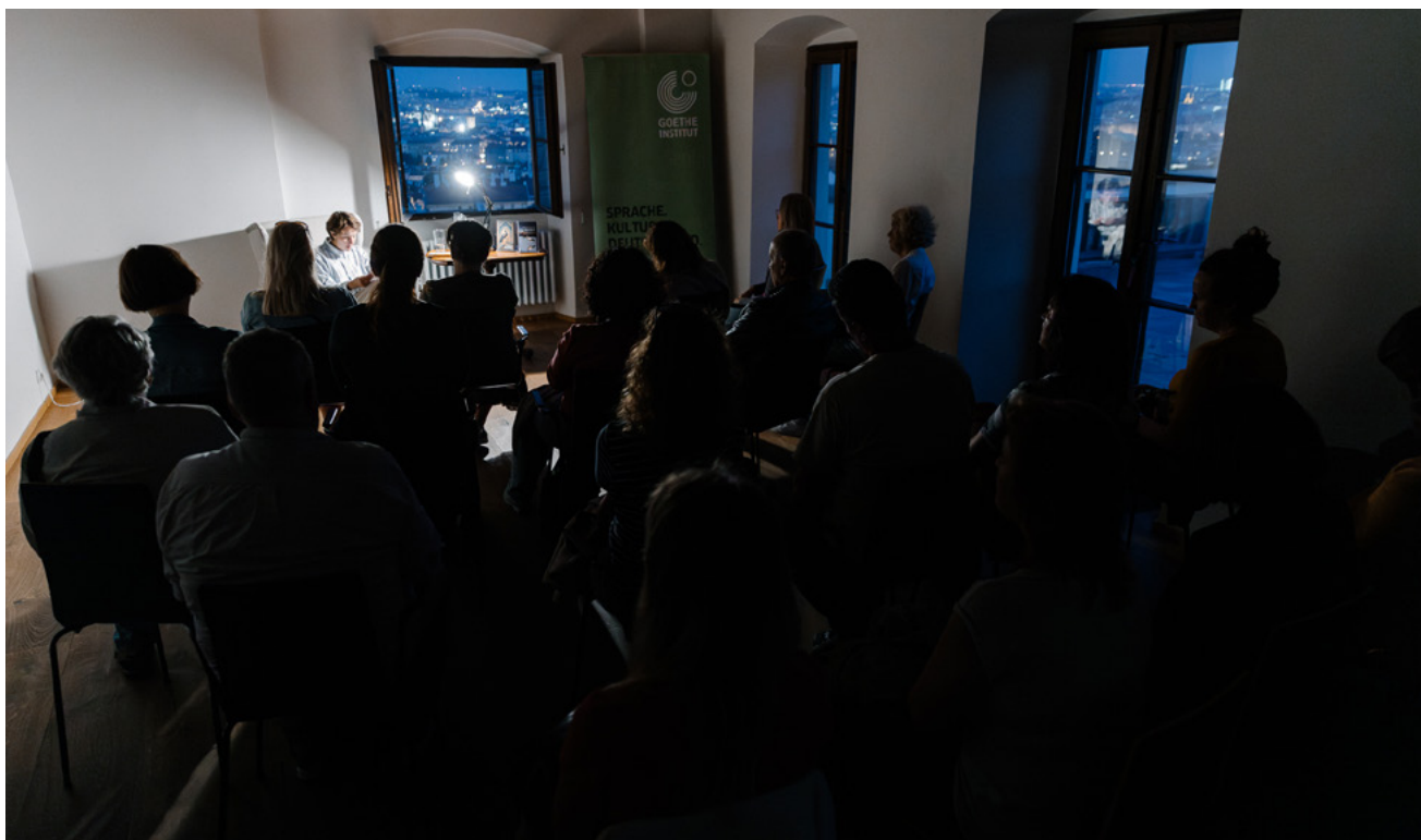
Německo – Fortna-II