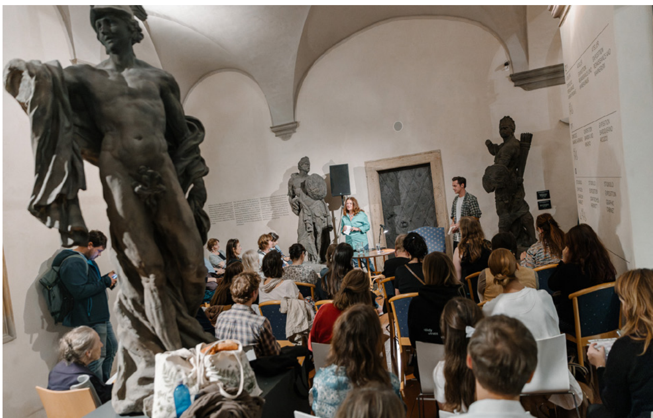
Itálie – Schwarzenberský palác/Národní galerie