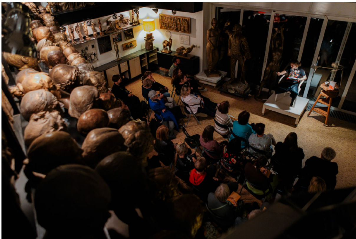
Slovensko – Dům U Zlaté hvězdy/ateliér