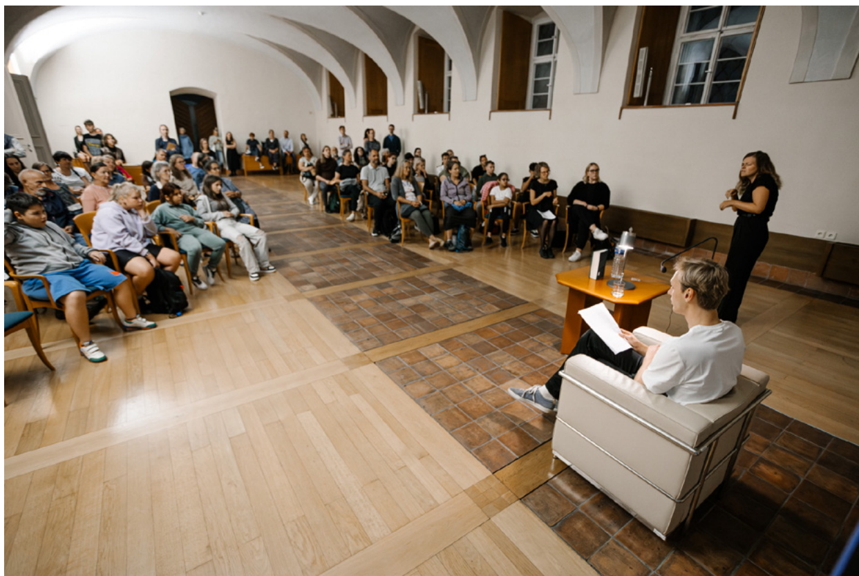
Ukrajina – Toskánský palác