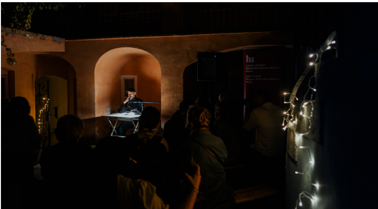
Maďarsko – Dvorek domu U Zlatého pluhu