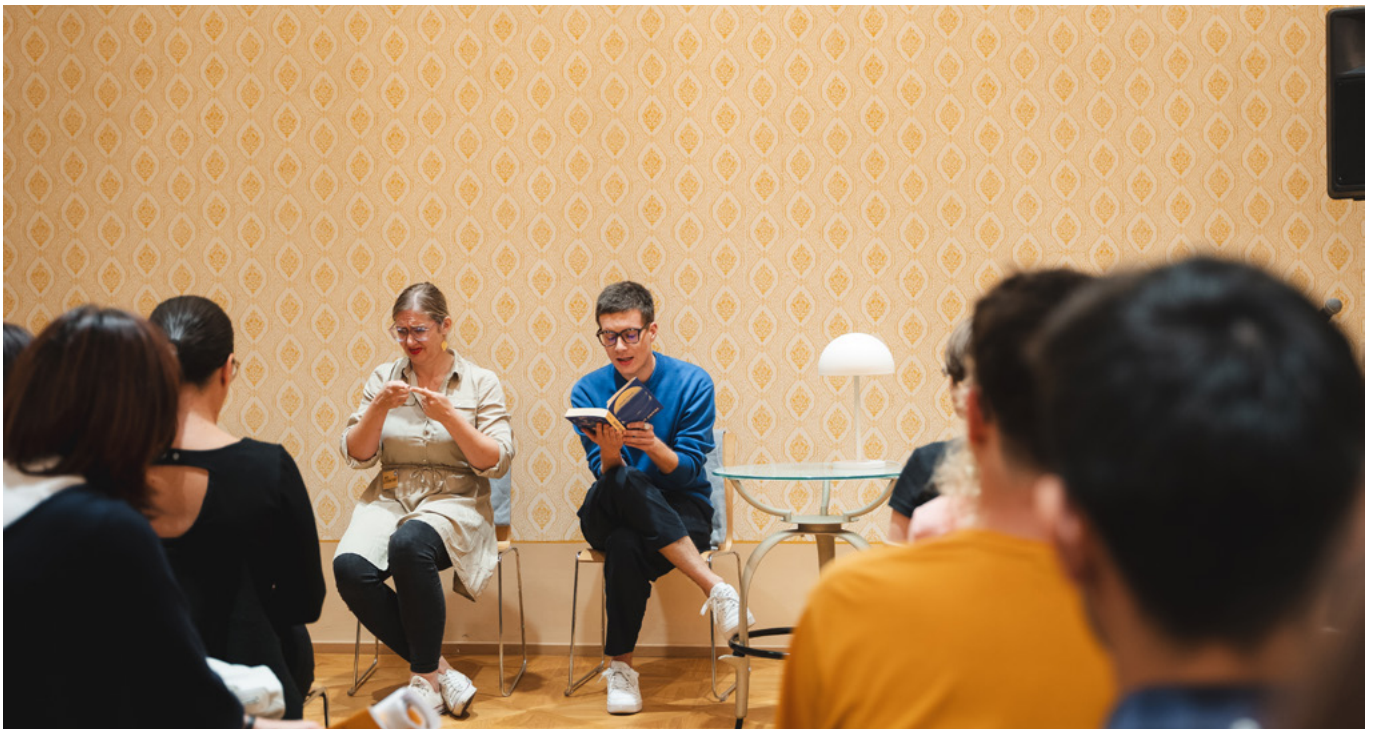
Česko – Malá Vikárka