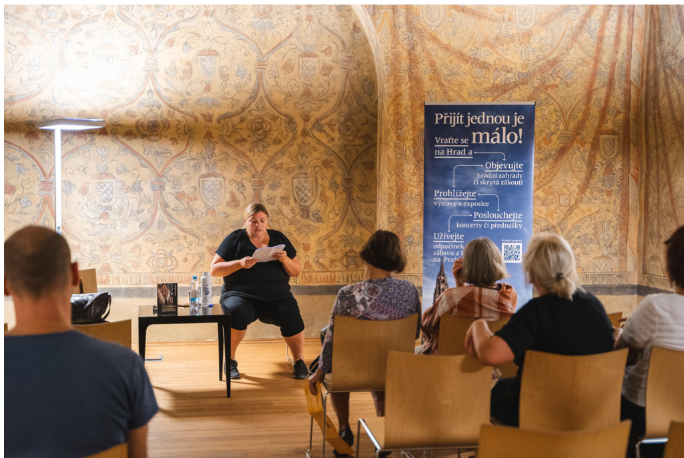
Romská literatura – Nejvyšší purkrabství