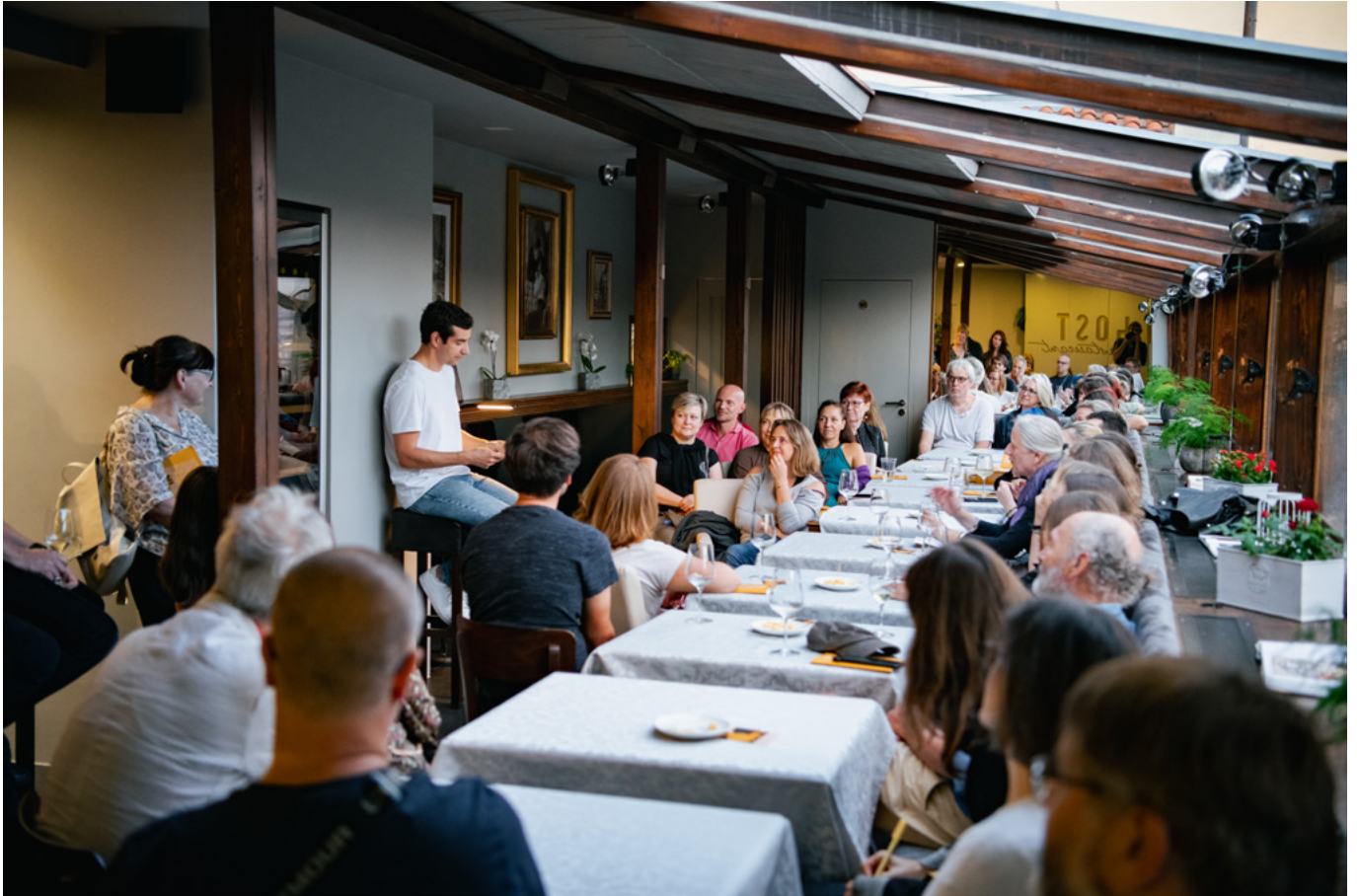
Litva – Host restaurant