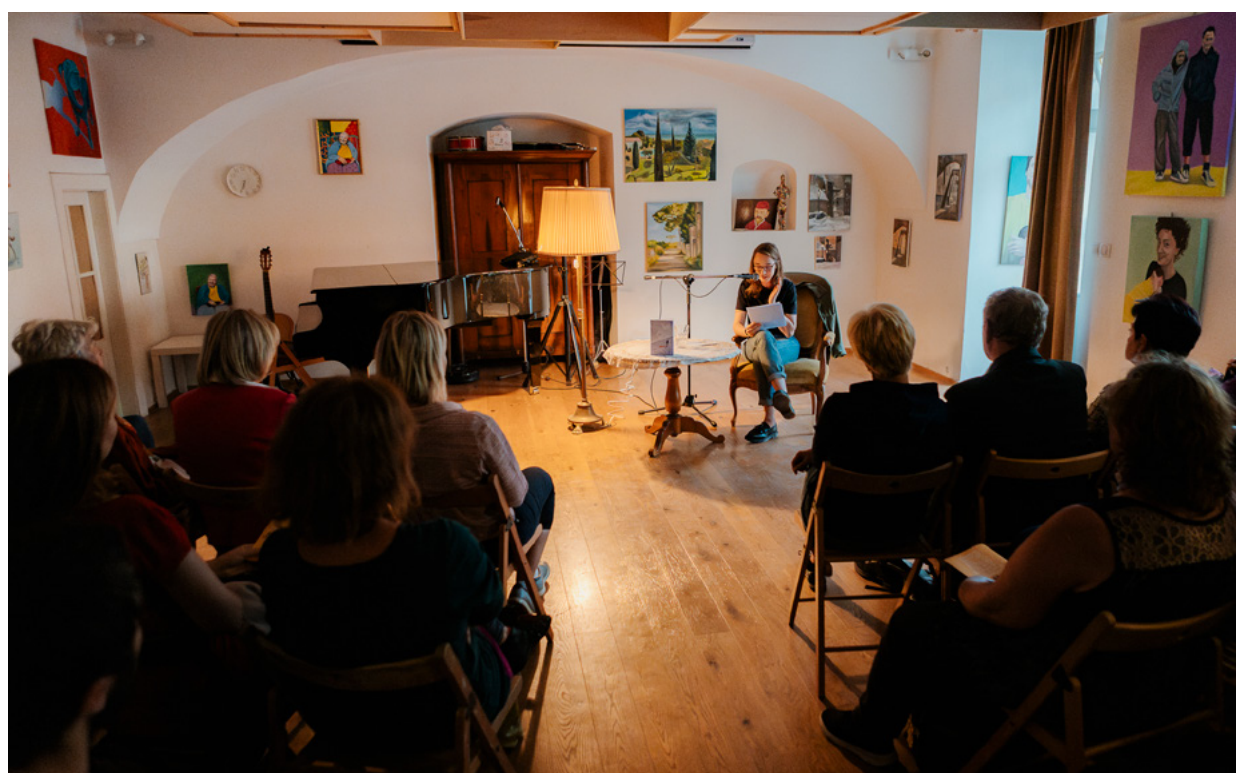
Norsko – ZUŠ Orphenica/Šlikův palác