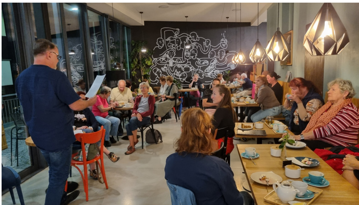
Nové Město nad Metují