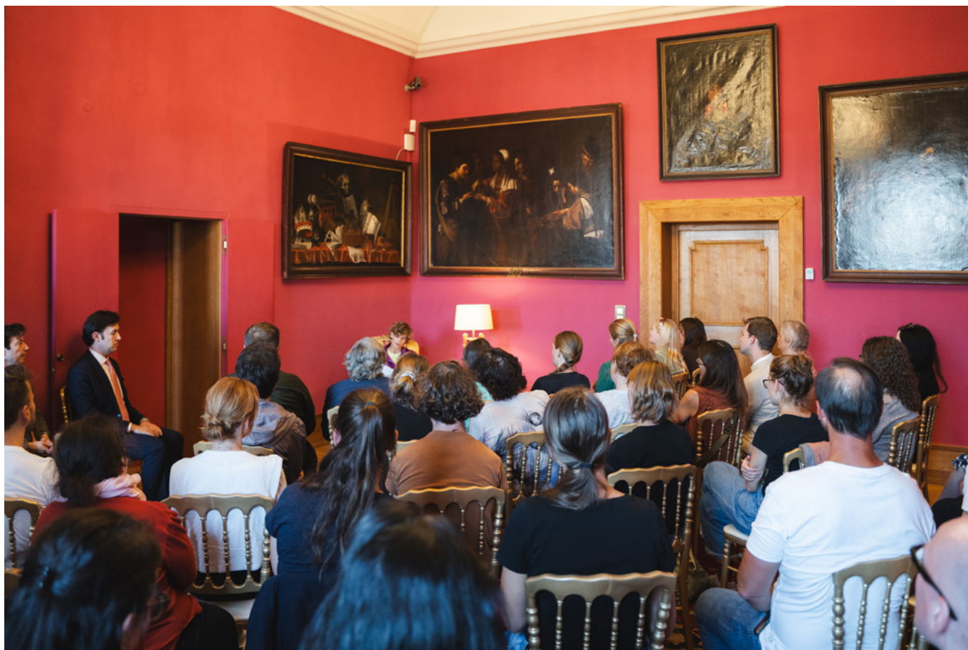
Španělsko – Lobkowiczký palác