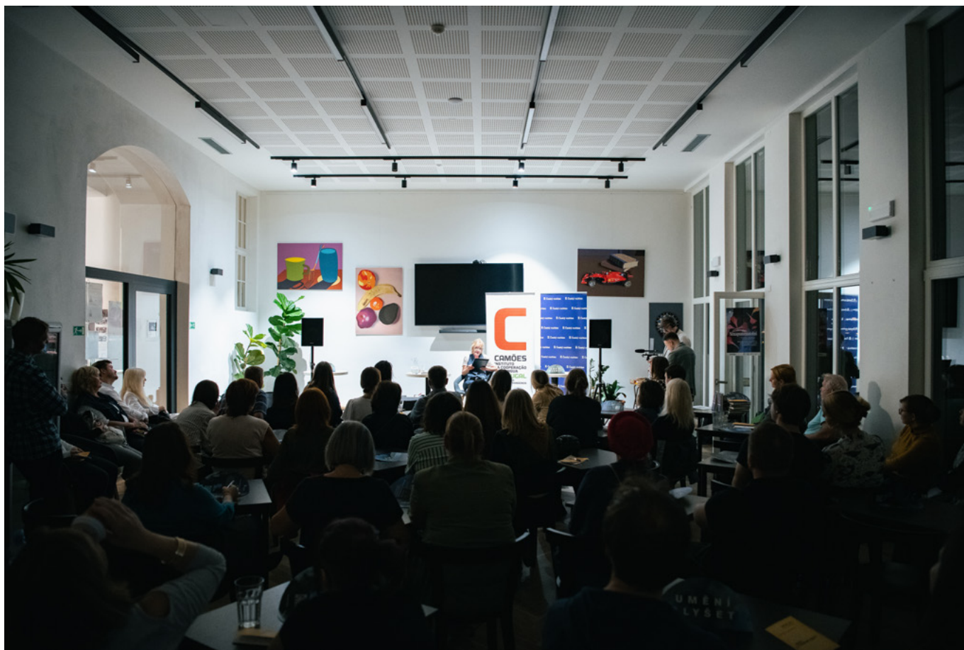
Portugalsko – Park Lane International School/Řeholní dům Povýšení sv. Kříže