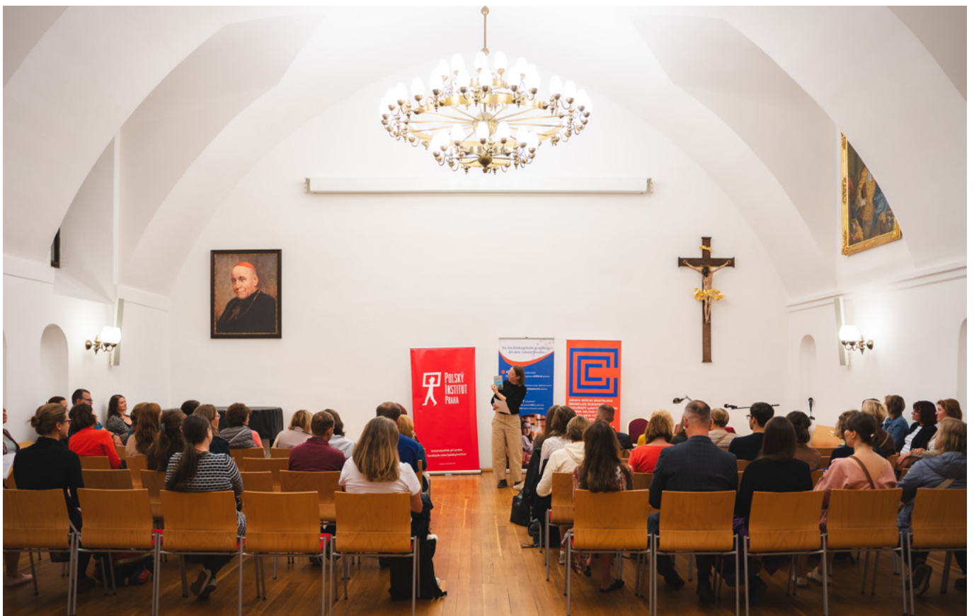
Polsko – Arcibiskupský palác