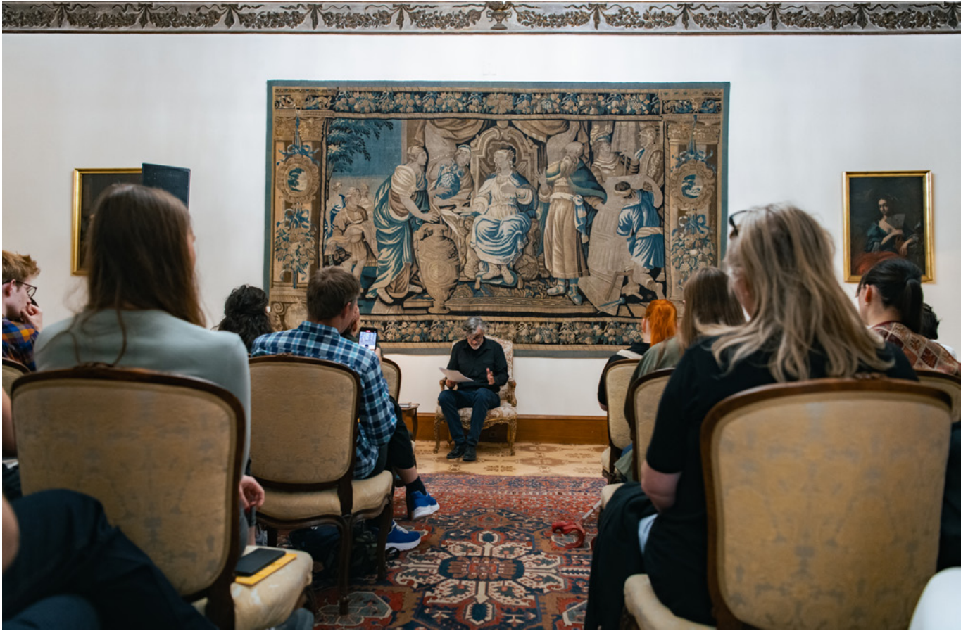
Bulharsko – Hrzánský palác