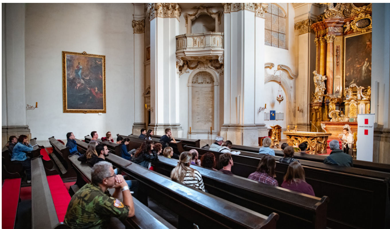
Rakousko – Vojenský kostel sv. Jana Nepomuckého