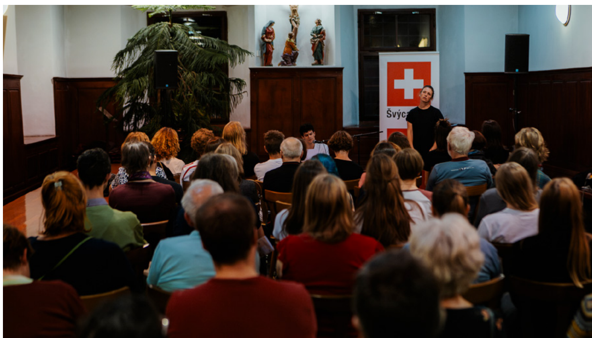
Švýcarsko – Klášter kapucínů v Praze na Hradčanech