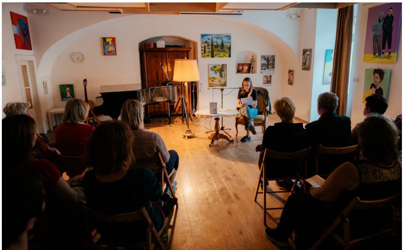
Norway – Slik Palace / Orphenica Private Art School