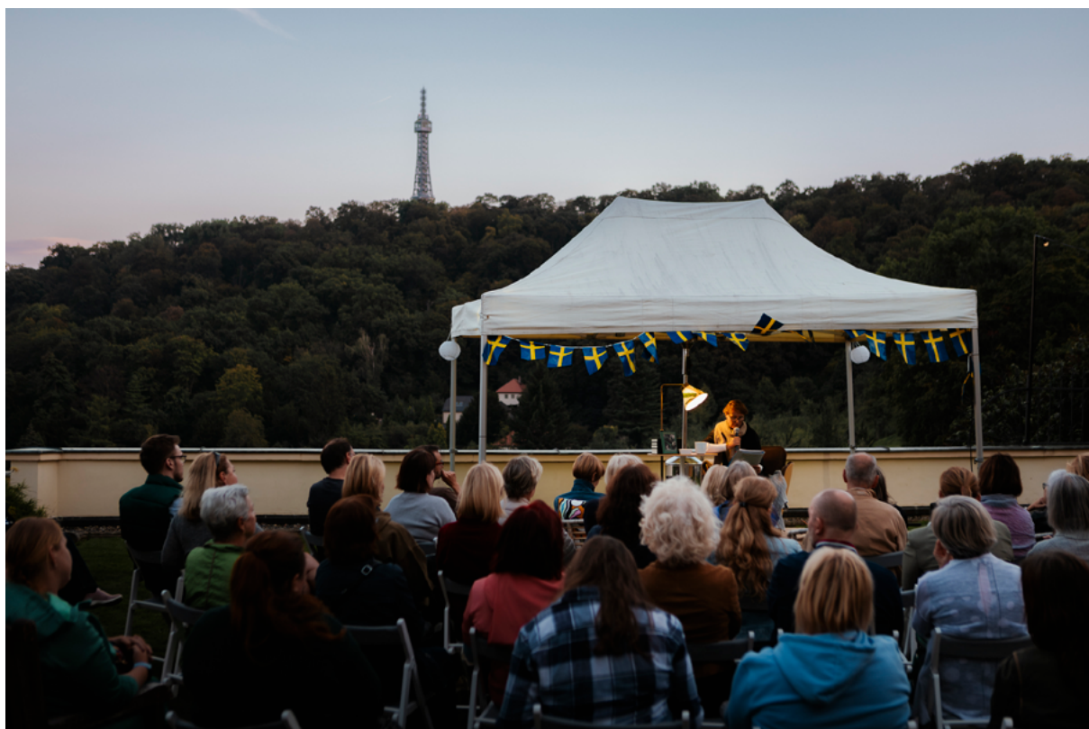
Sweden – Embassy of Sweden / Na Krásné Vyhlídce Villa