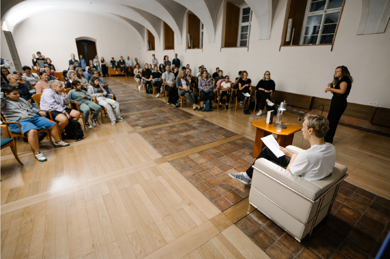
Ukraine – Tuscany Palace