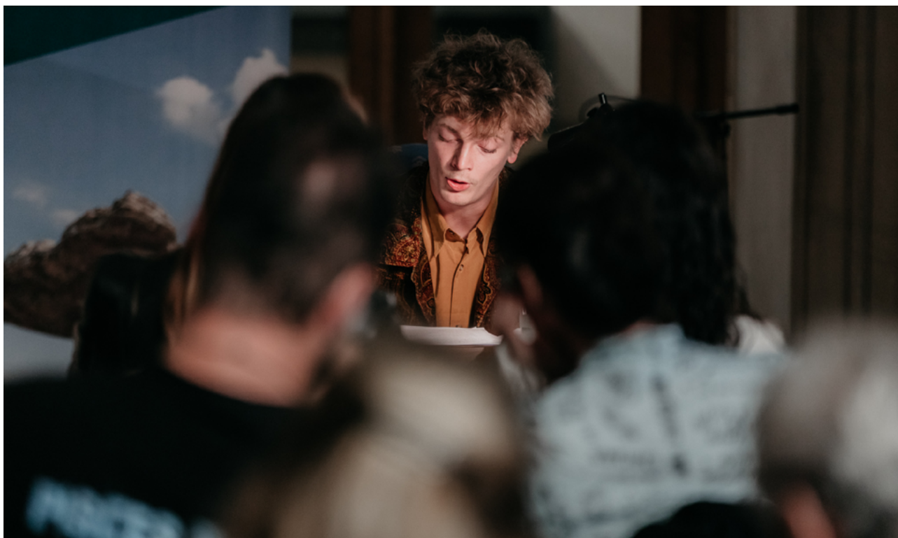
Ireland – Sternberg Palace / National Gallery Prague