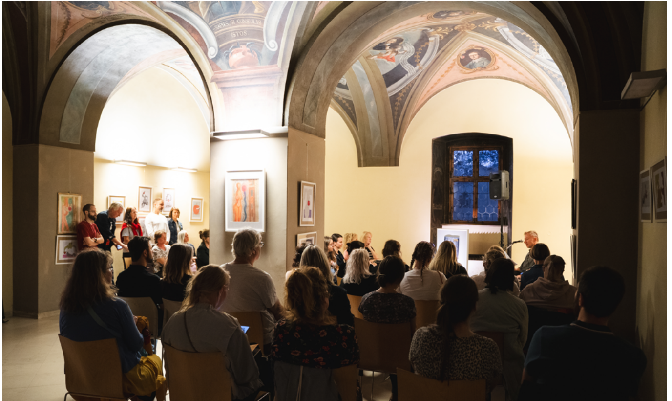
Netherlands – Mladota House