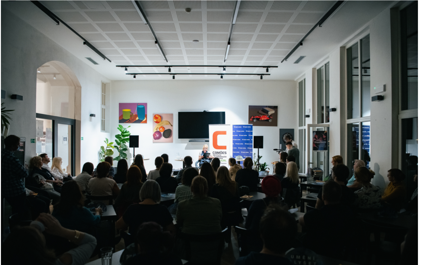
Portugal – Monastic House of the Exaltation of the Holy Cross / Park Lane International School