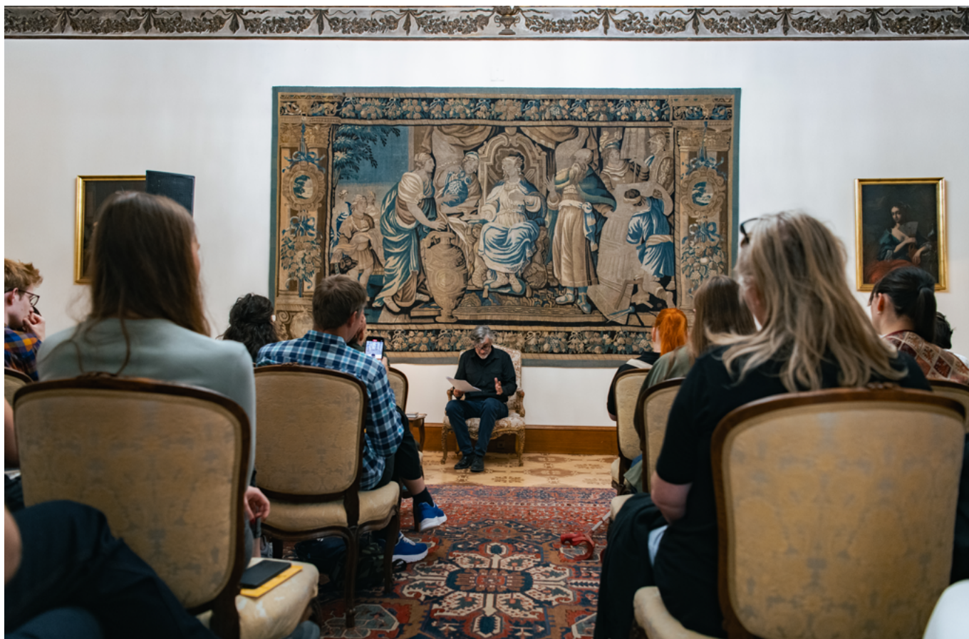
Bulgaria – Hrzánský palace