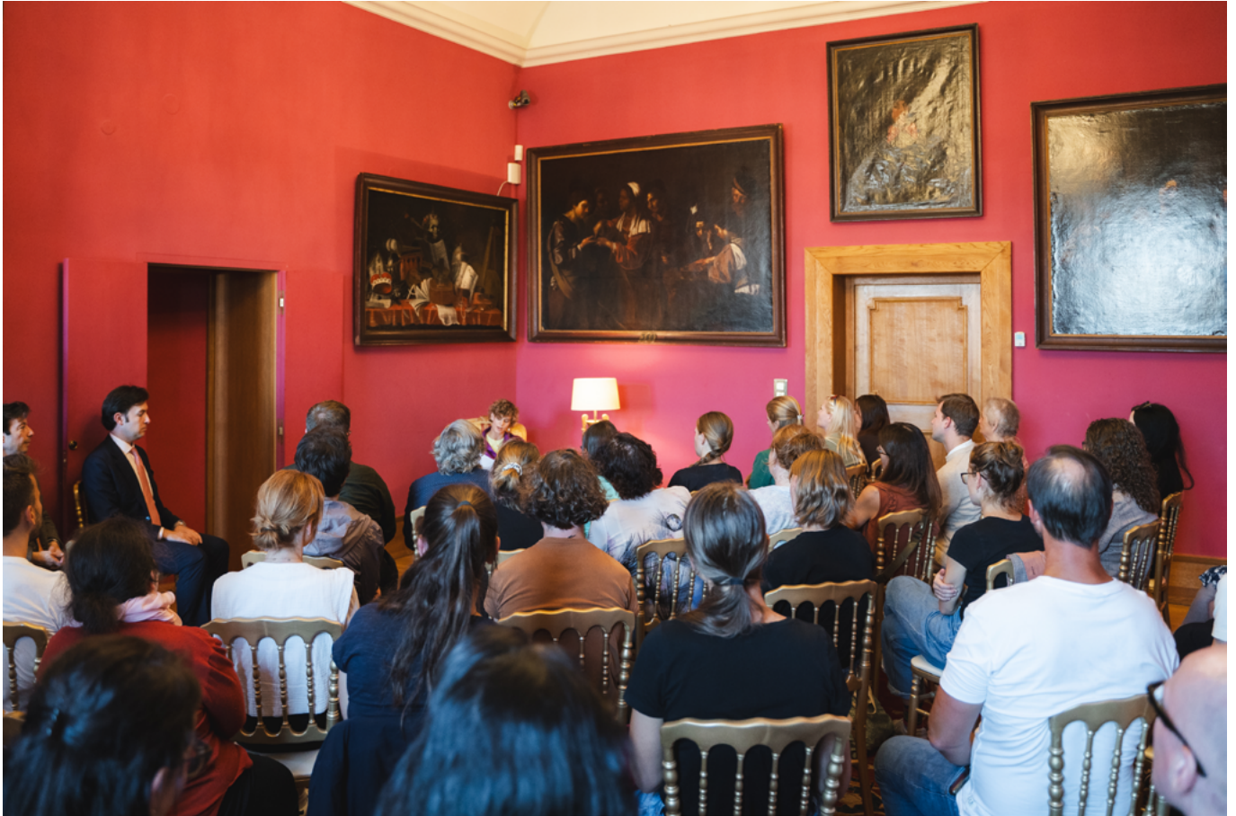
Spain – Lobkowitz Palace