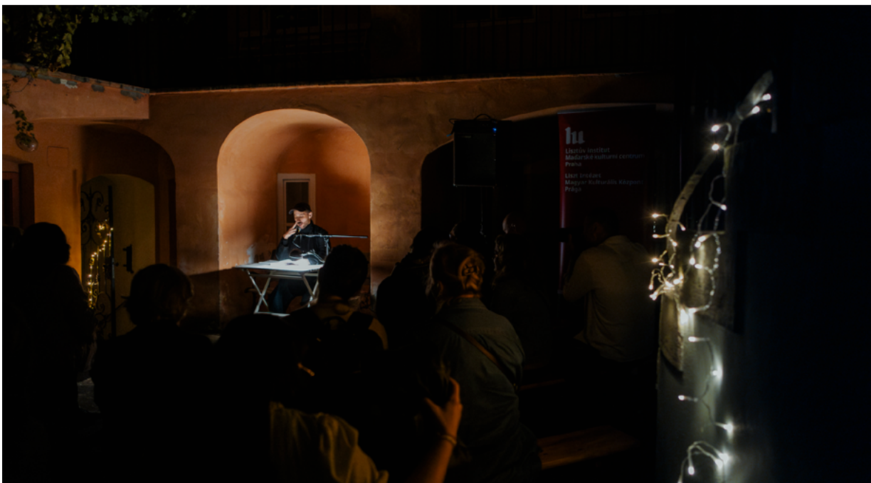
Hungary – Townhouse at the Golden Plough's Courtyard