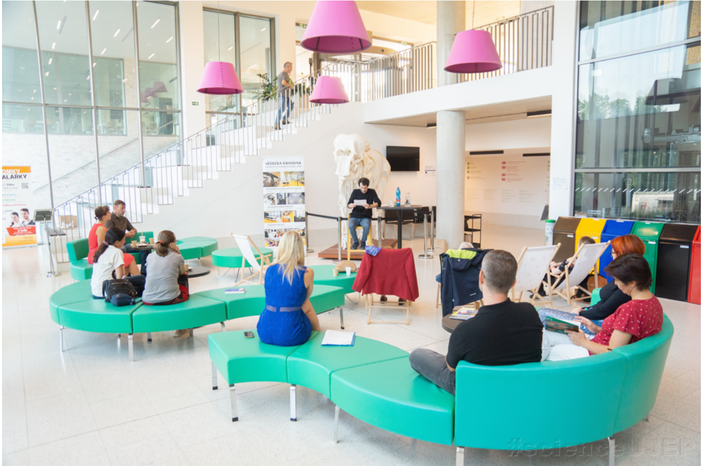
Ústí nad Labem