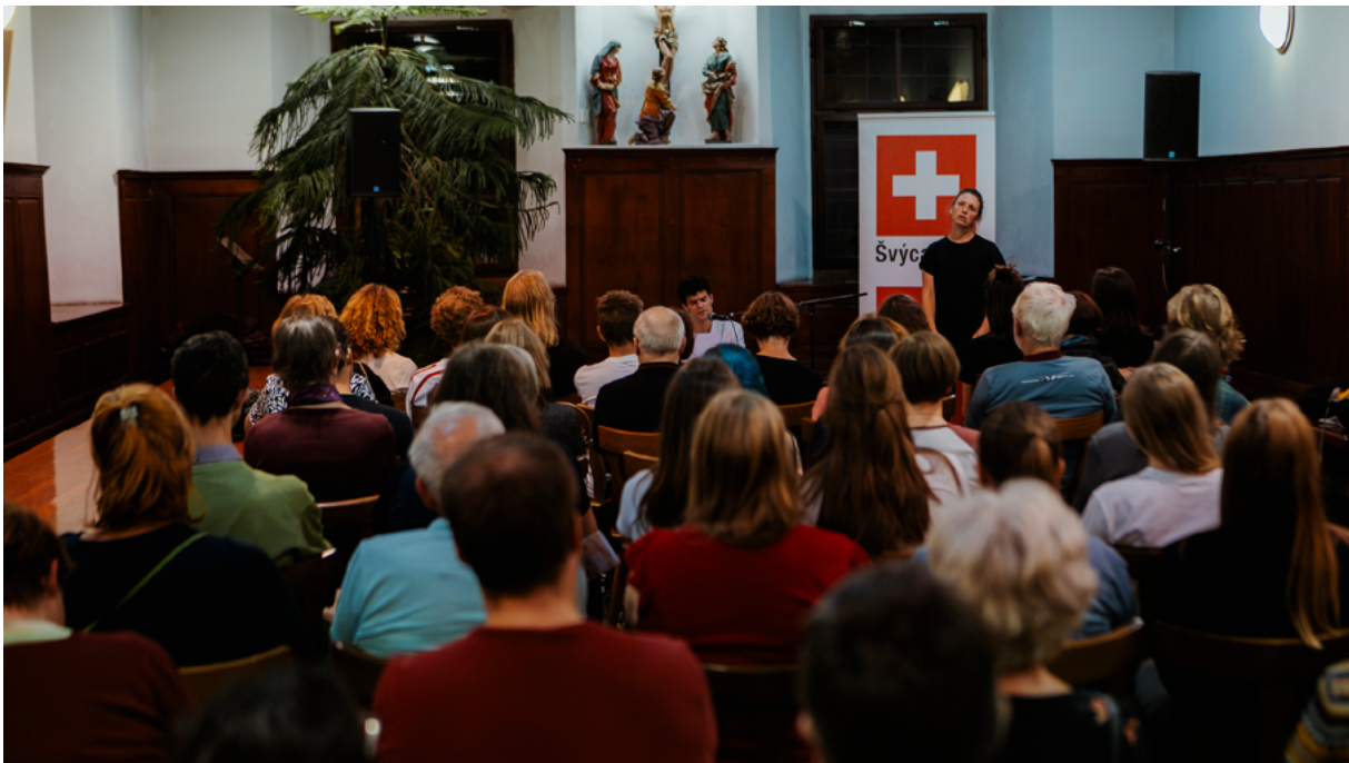
Switzerland – Capuchin Monastery in Hradčany