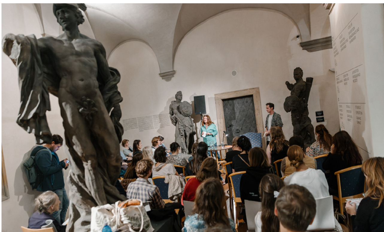
Italy – Schwarzenberg Palace / National Gallery Prague