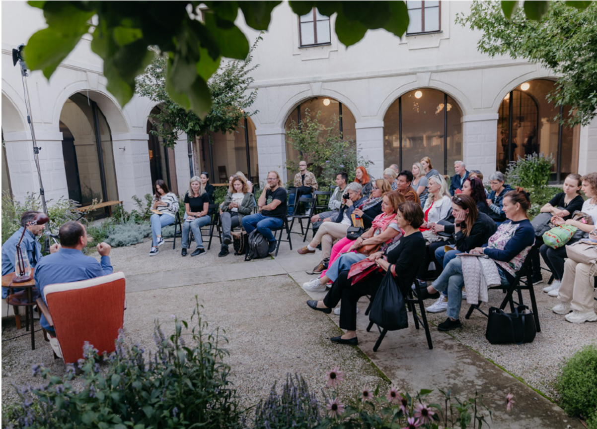
Denmark – Fortna I