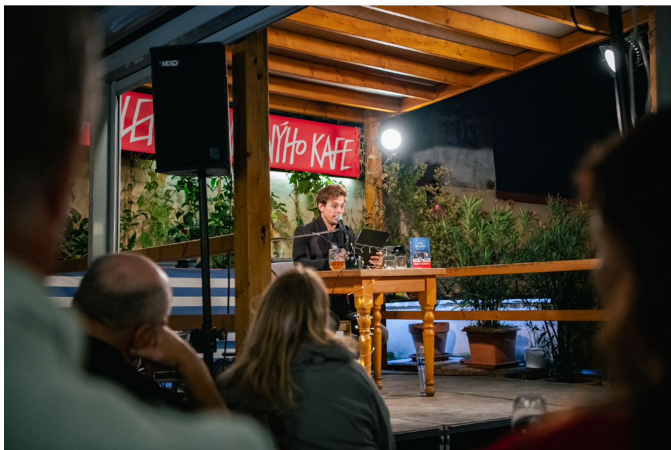
Great Britain – U zavěšeného kafe / Divadlo pokračuje (At the Hanging Coffee / Theatre Continues)