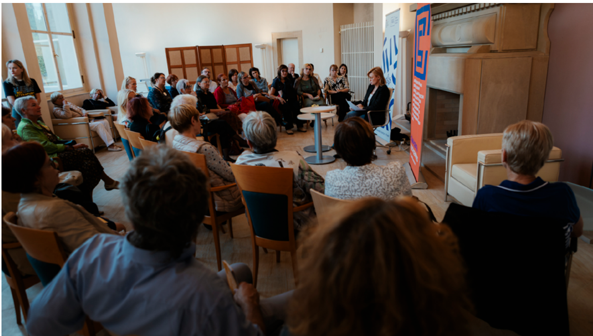
France – Kaňka Pavilion / The Czernin Palace