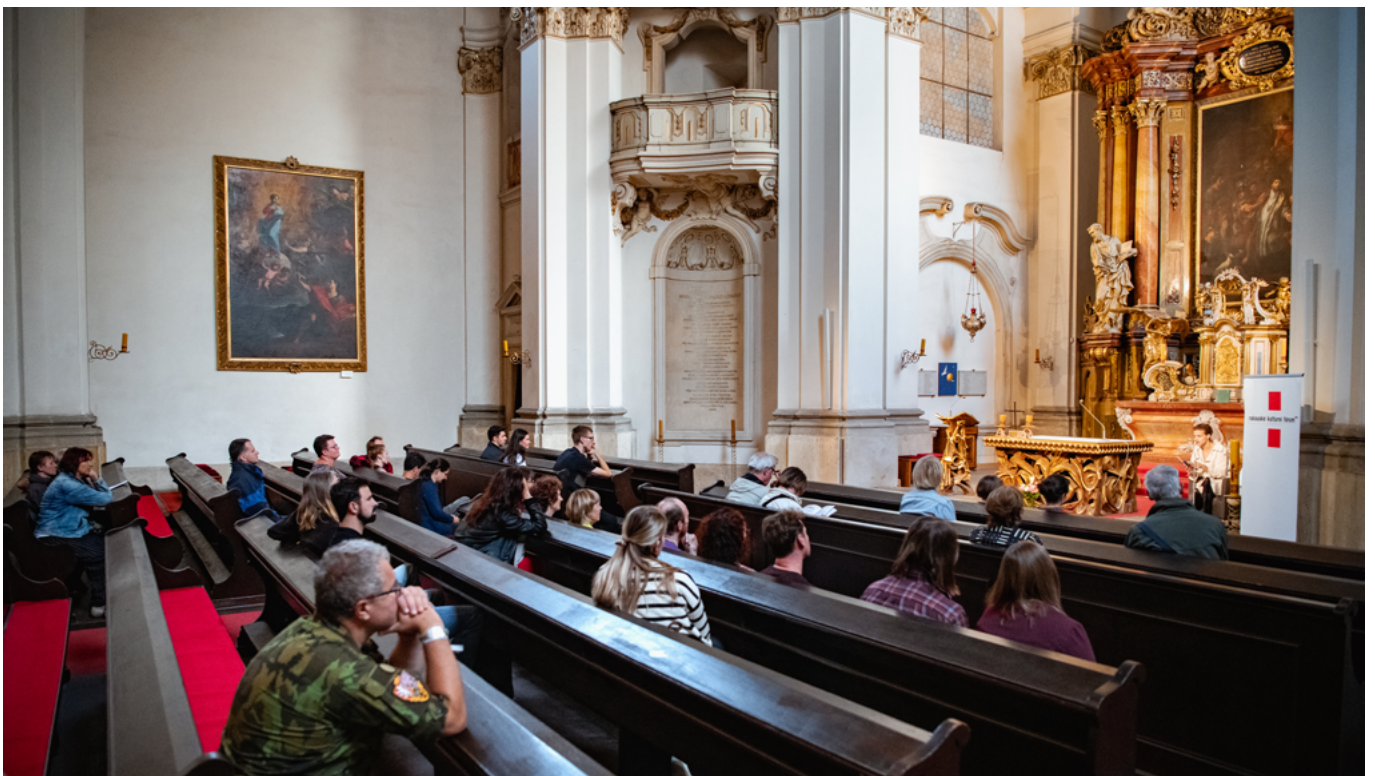
Austria – Military Church of Saint John of Nepomuk