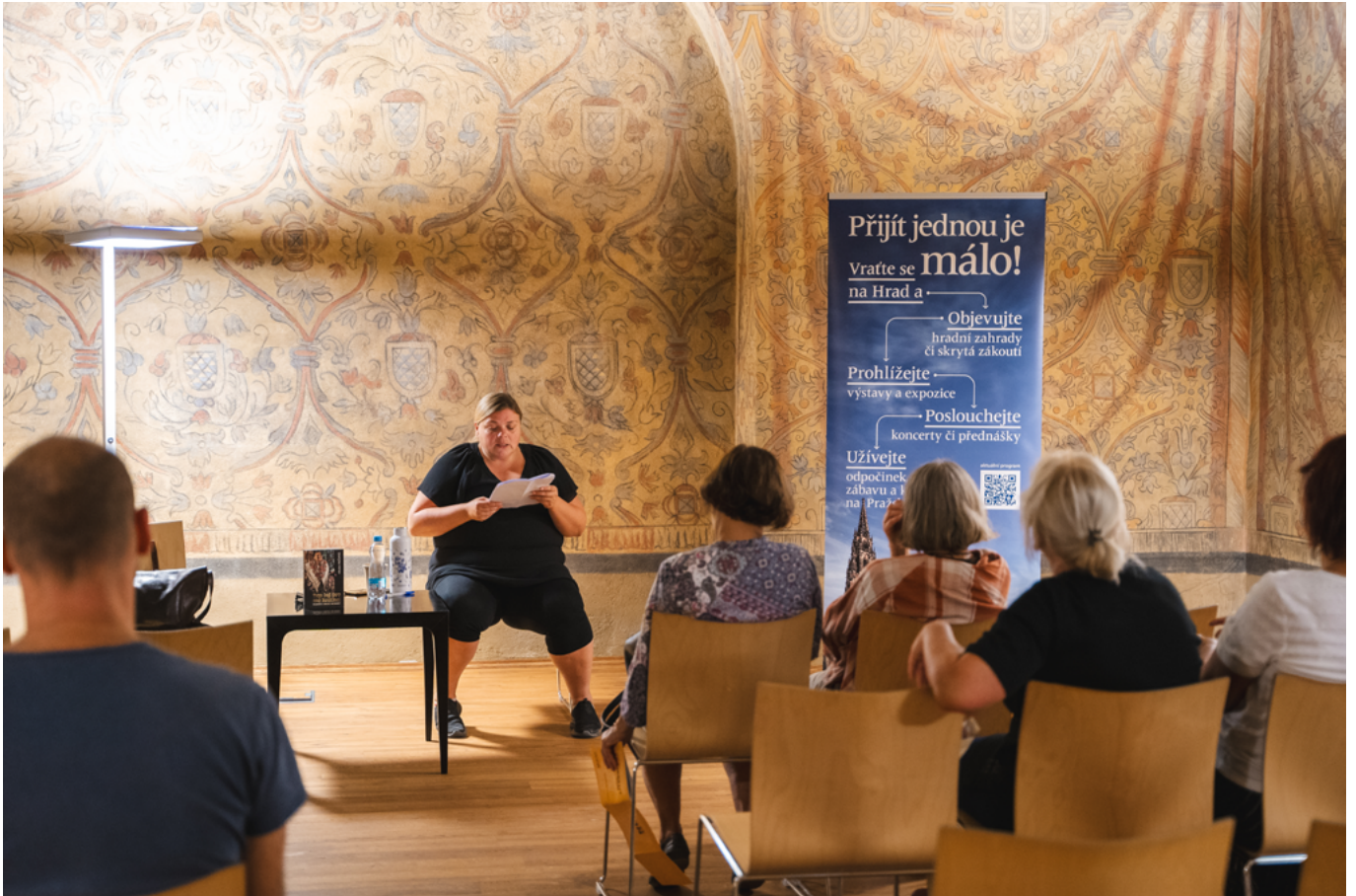
Romani literature – Supreme Burgrave's House