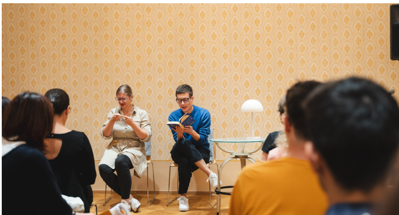
Czechia – Malá Vikárka