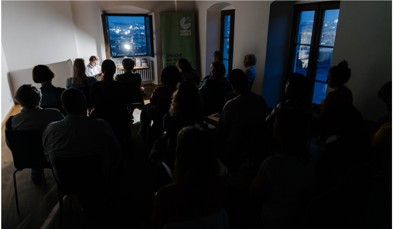
Germany – Fortna II